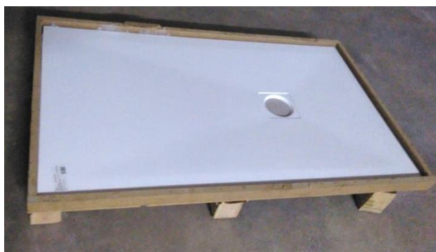
Muestra AIDIMME 1705189-03