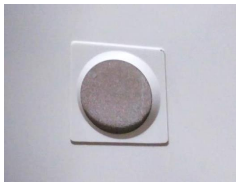
Detalle del orificio de desagüe